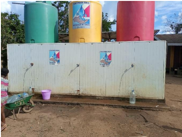
SA MO 1506-2