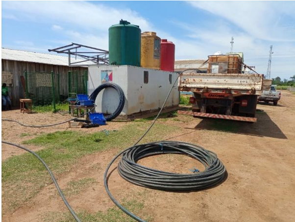
SA MO 1506 - 1