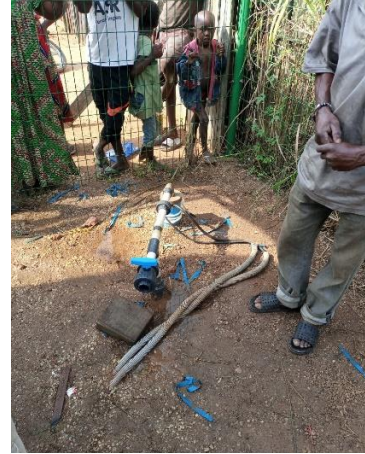
SA MO 1505-1