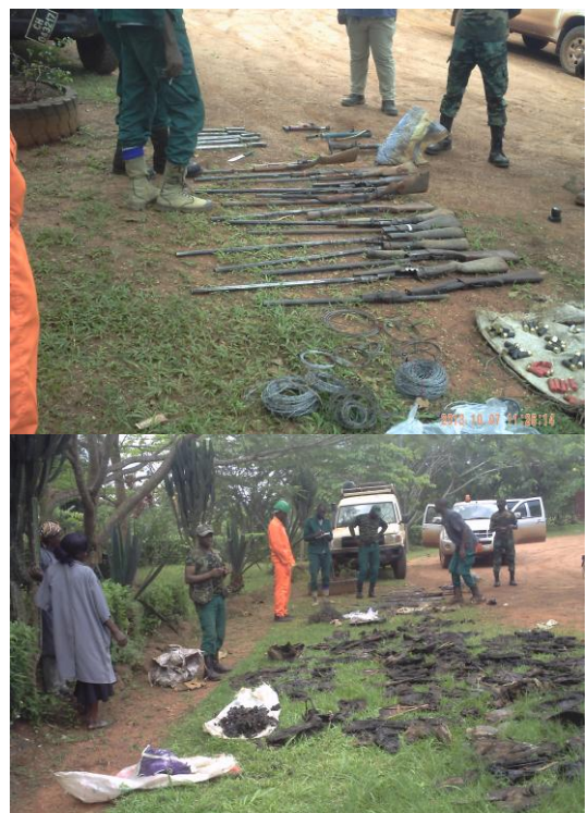
Saisies mission LAB SFID-Mbang

Chez Pallisco également, en plus de l'augmentation des efforts de patrouille avec le MINFOF, les contrôles inopinés en interne ont été relancés, mais se déploient timidement en l'absence d'un responsable faune. L'arrivée de ce dernier devrait permettre de combler le