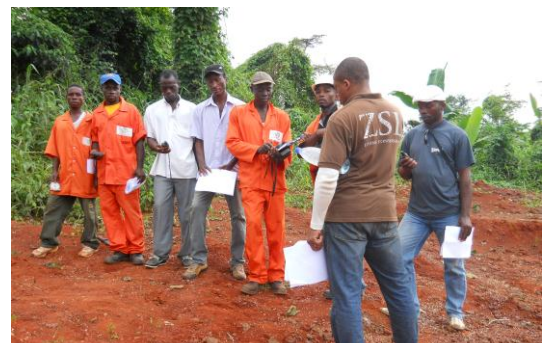
Formation cybertracker, GPS, carte

Pour le personnel de terrain, au moins 03 séries de formations ou de recyclages à la lecture de la carte,